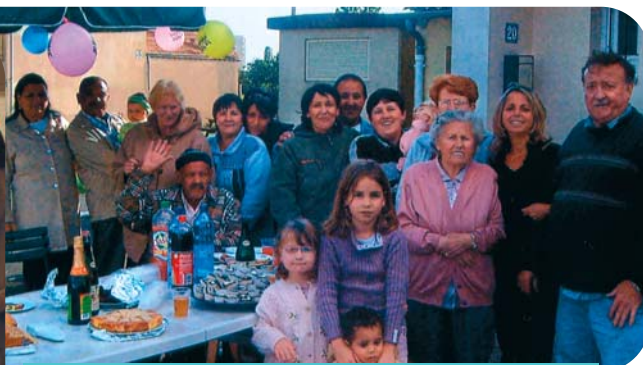
Photo de famille impasse des Celtes. Pour une première c'était réussi ! D'ailleurs c'est dit, les locataires remettront ça l'année prochaine !