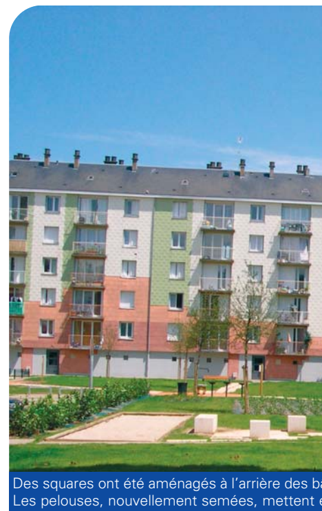
Des squares ont été aménagés à l'arrière des bâtiments. Les pelouses, nouvellement semées, mettent en valeur l'espace.