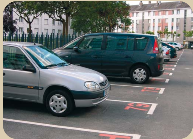
Les places de parkings sont numérotées et attribuées aux résidents.

Lorsque le nombre de places de stationnement, au sein de l'enceinte de sa résidence, est, malgré tout, inférieur au nombre de logements, les places sont attribuées en fonction de critères de priorité: familles nombreuses, personnes malades ou handicapées, etc.