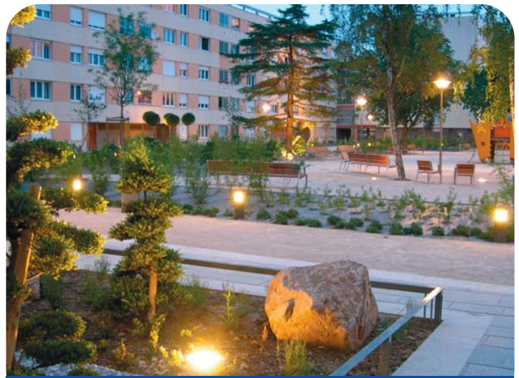
Lumières du soir : candélabres et bancs, invitent à la promenade.