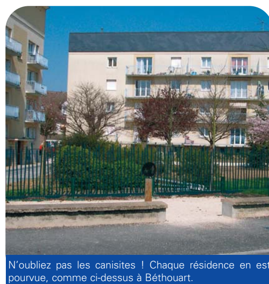
N'oubliez pas les canisites ! Chaque résidence en est pourvue, comme ci-dessus à Béthouart.