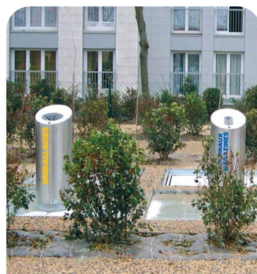
Écologique : les abris extérieurs pour ordures ménagères ont été remplacés par des conteneurs enterrés.