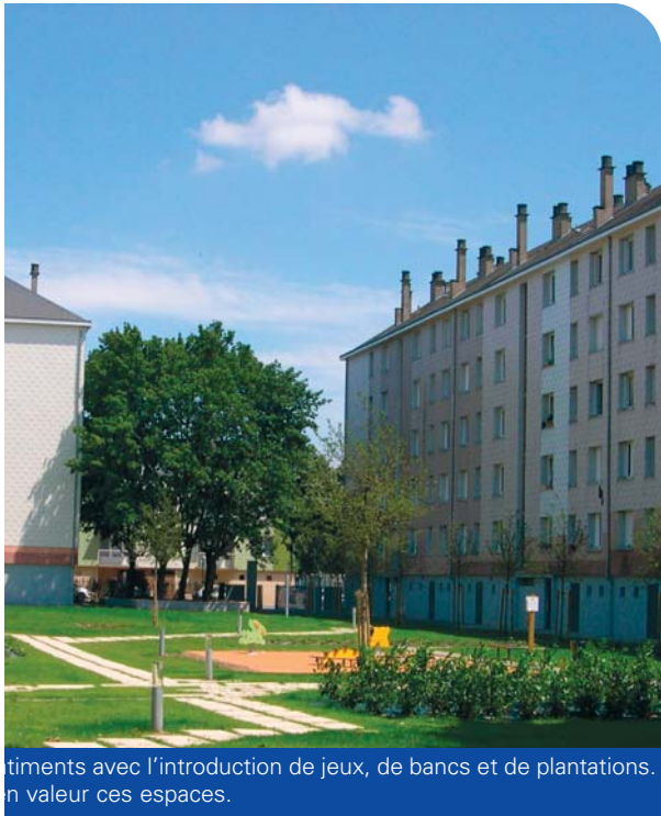
timents avec l'introduction de jeux, de bancs et de plantations. n valeur ces espaces.