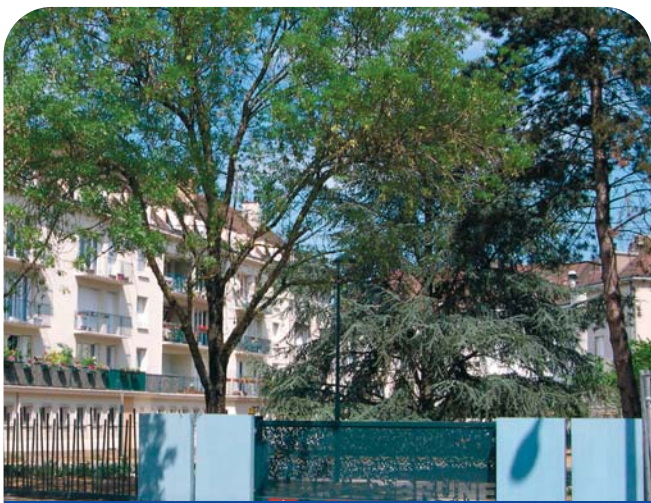
Square et parking privatifs à Charles Brune.