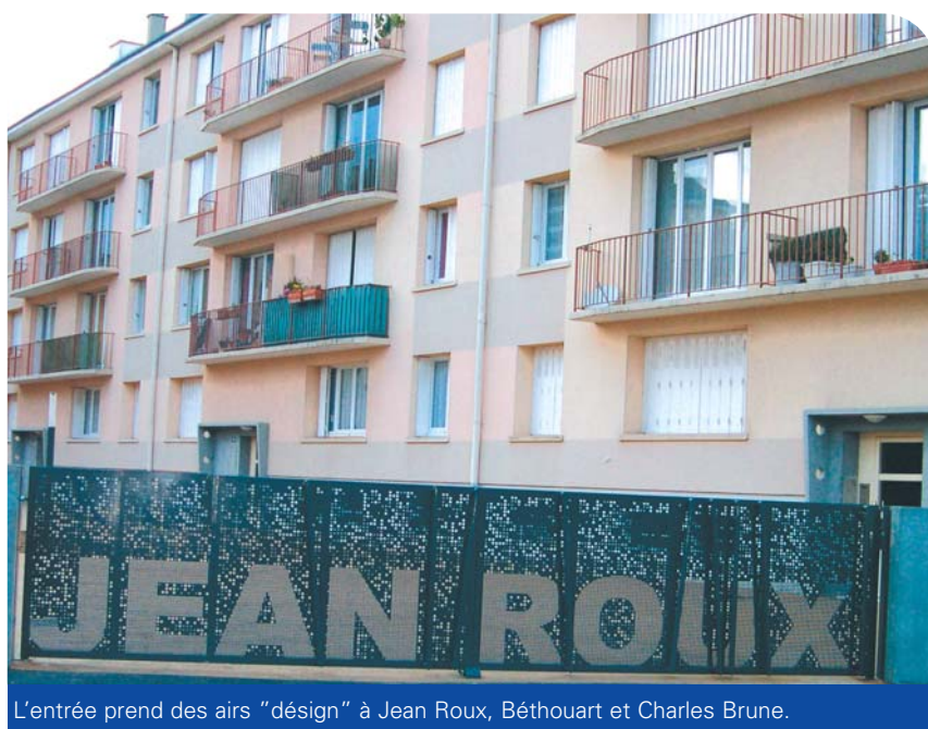
L'entrée prend des airs "design" à Jean Roux, Béthouart et Charles Brune.