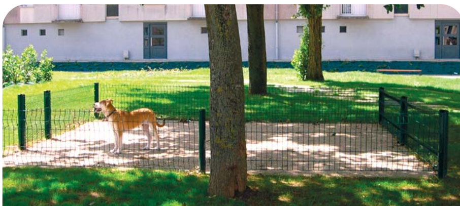
Grâce aux canisites, le comportement des propriétaires de chiens change pour le plus grand confort de tous.

(Retrouvez l'ensemble des adresses correspondant aux résidences page 8 de ce numéro).