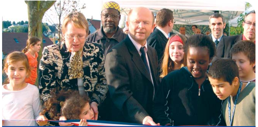
Les élus ont coupé le ruban inaugural de chaque résidence, entourés des enfants du quartier.