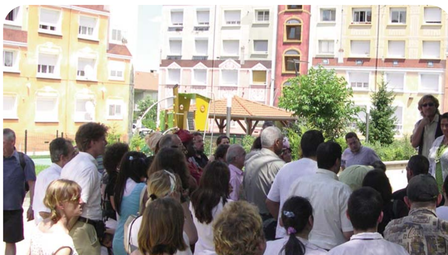
Les fresques du quartier La Sarra ont enthousiasmé les locataires.

Les locataires de Bel Air ont pu, jusqu'au 25 juillet, faire savoir s'ils souhaitent se lancer dans l'aventure.