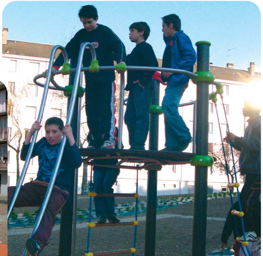
Des jeux sont installés partout, pour tous les âges.