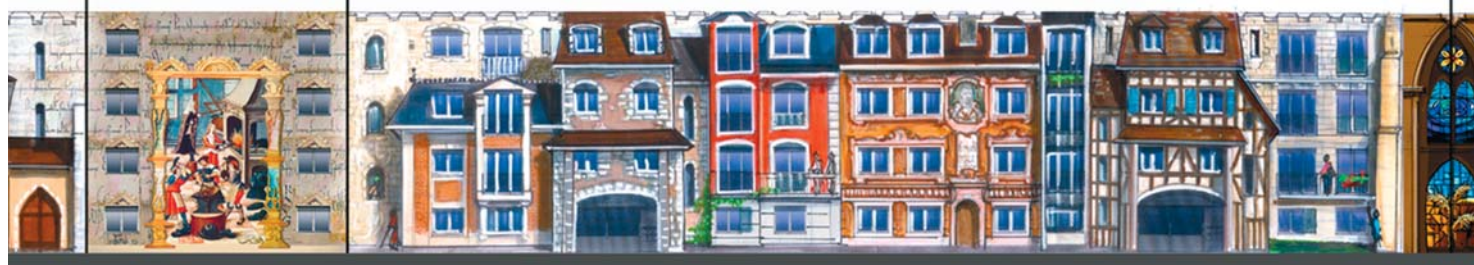
Ci-dessus, le projet de fresque pour l'immeuble situé rue des Saules. La façade présenterait une reproduction des vitraux de la cathédrale, des maisons remarquables du centre ville de Chartres, mais aussi des détails de l'architecture tchèque et un extrait de l'œuvre de Bruegel.