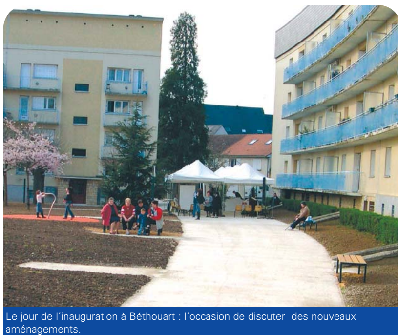
Le jour de l'inauguration à Béthouart : l'occasion de discuter des nouveaux aménagements.