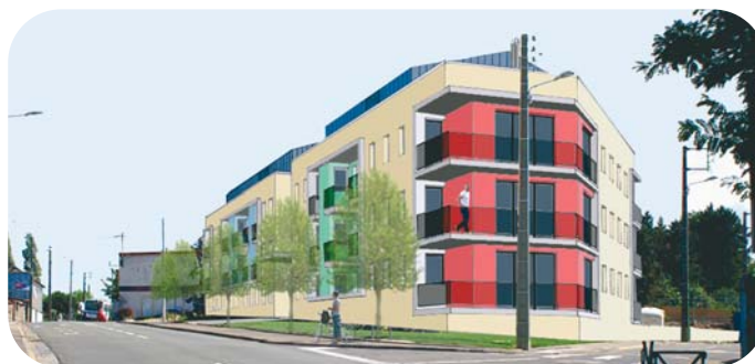
La construction commencera en octobre 2007 pour une livraison au 4 ème trimestre.

L'environnement a été valorisé puisque 40 % de l'espace sera aménagé avec des pelouses, des arbustes, un minimum de onze arbres, des cheminements piétonniers, etc. ●