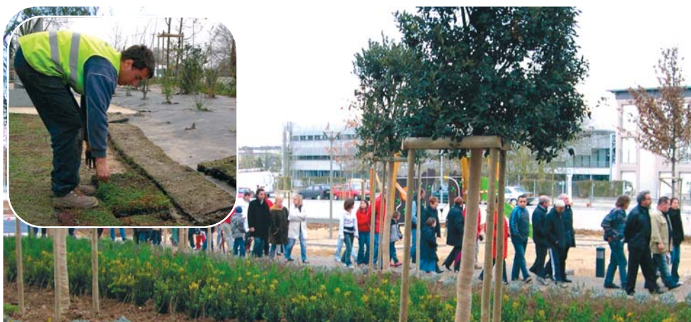
Chaque résidence fait la part belle aux plantations.