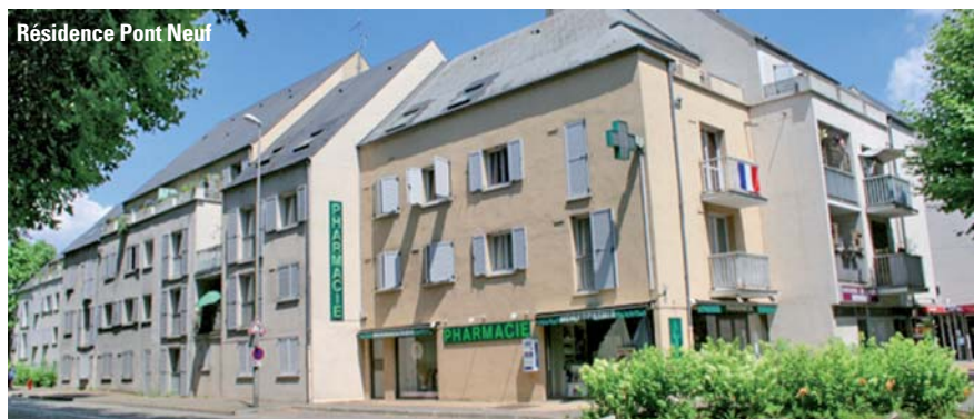
Résidence Pont Neuf