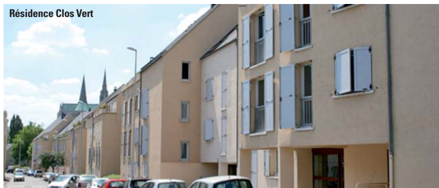
Résidence Clos Vert