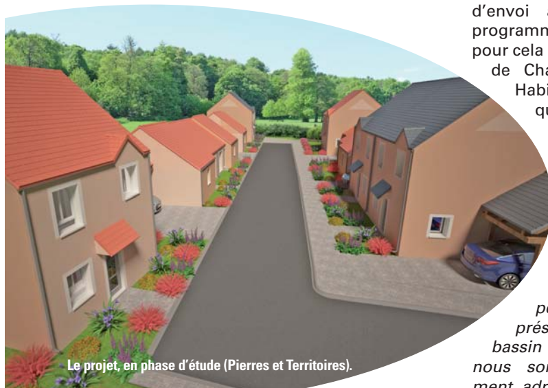
Le projet, en phase d'étude (Pierres et Territoires).

L'année 2019 verra la concrétisation de ce projet dans le cadre d'un Contrat de Promotion Immobilière passé par Chartres Métropole Habitat. ■