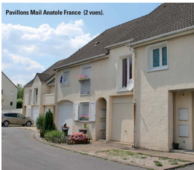
Pavillons Mail Anatole France (2 vues).