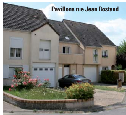
Pavillons rue Jean Rostand