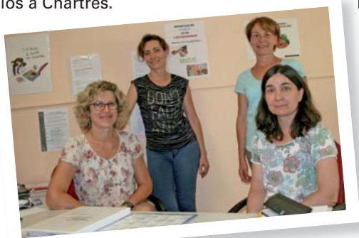
Une partie de l'équipe intervenante.

Le Centre de Santé Polyvalent du CCAS est ouvert depuis le mois de janvier, dans le quartier des Clos à Chartres.