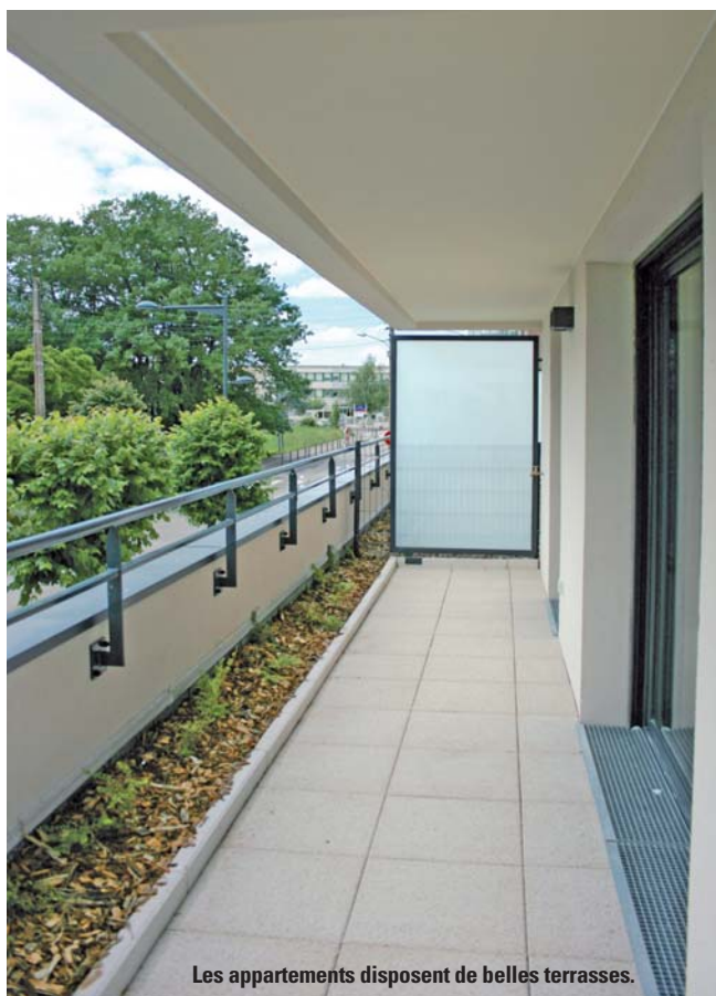
Les appartements disposent de belles terrasses.

Loyer 591 € Surf. utile: 104,05 m 2 . Surf. habitable: 97,70 m 2 .