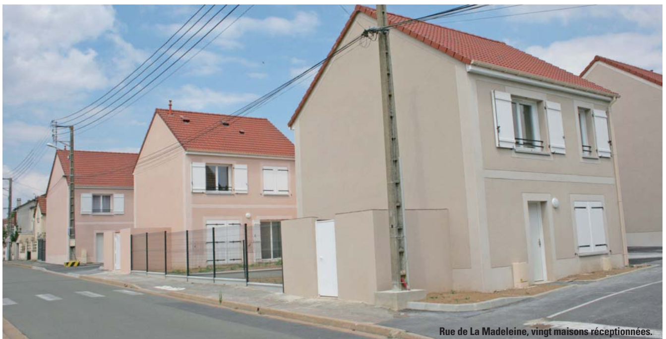
Rue de La Madeleine, vingt maisons réceptionnées.