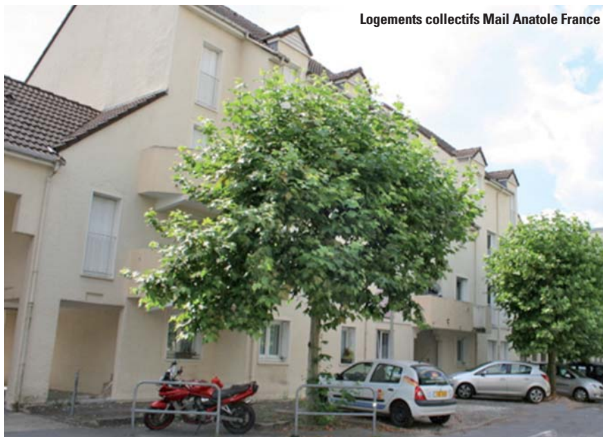
Logements collectifs Mail Anatole France