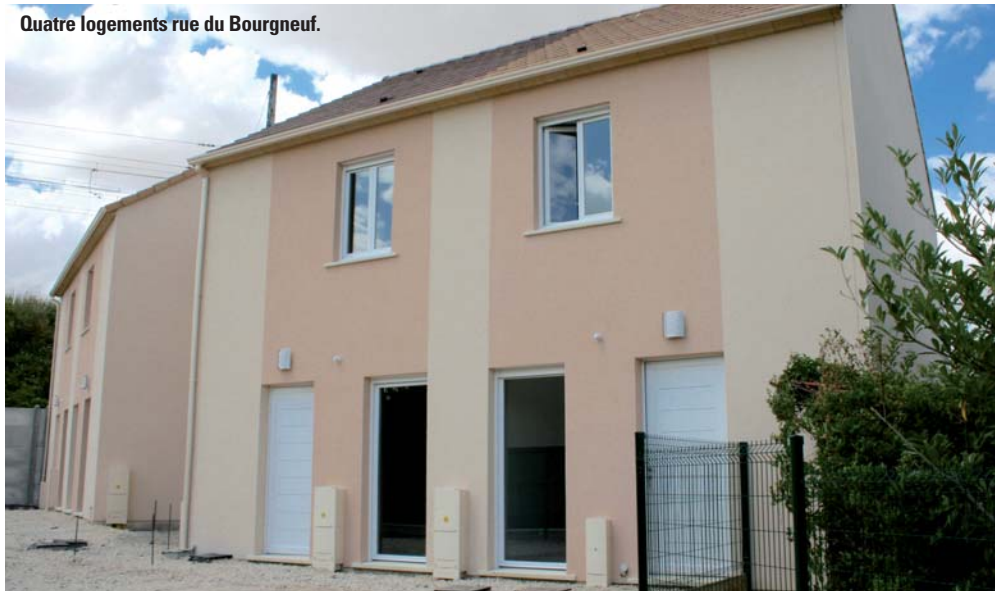
Quatre logements rue du Bourgneuf.

Il s'agit de six types III d'une surface habitable de 83,90 m 2 dont les loyers sont de 476 et 422 €. Cela porte à dix le nombre de types III, six le nombre de type IV et quatre le nombre de types II à cette adresse. ■