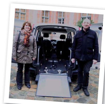
Le véhicule peut recevoir une personne en fauteuil roulant.

L'objectif est de sortir de la solitude les personnes qui s'isolent en raison de leur condition physique ou financière. Cette démarche peut aussi permettre au CCAS de détecter d'autres besoins et de mettre en place des aides complémentaires.