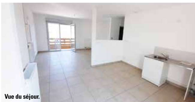
Vue du séjour.