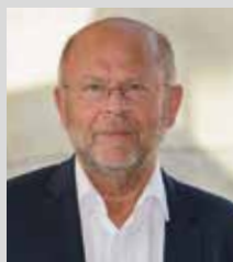
Jean-Pierre GORGES Président de Chartres Métropole Habitat Président de Chartres Métropole Maire de Chartres