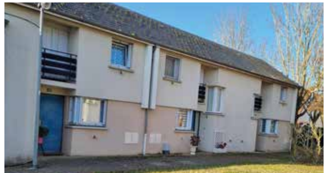
52, 54, 56, rue Raymond Isidore

Chartres Métropole Habitat ouvrira à la vente 116 logements situés dans le quartier des Hauts de Chartres durant le premier trimestre 2022.