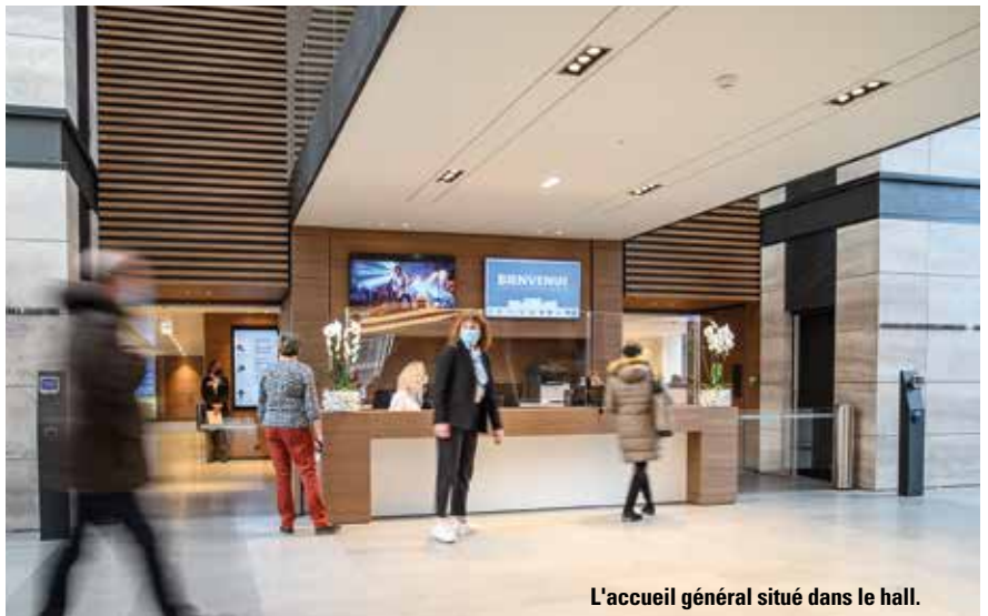
L'accueil général situé dans le hall.

Les numéros de téléphone et adresses mails restent inchangés.