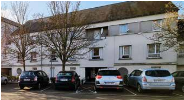
23 et 25, rue Raymond Isidore