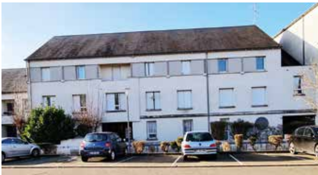
19 et 21, rue Raymond Isidore

Chartres Métropole Habitat ouvre à la vente une centaine de logements, collectifs et individuels, dans le quartier des Hauts de Chartres.