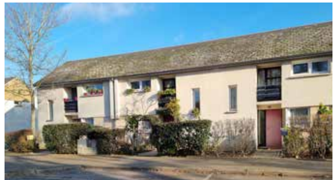
23 et 26, rue des Hauts de Chartres