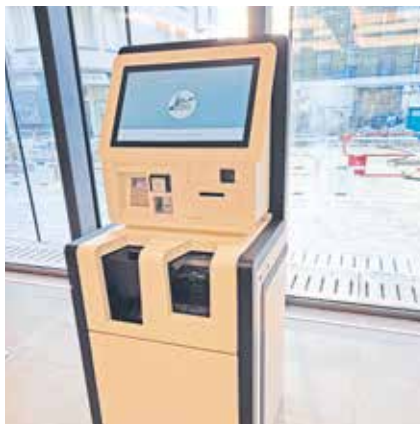
La borne de paiement.