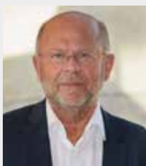
Jean-Pierre GORGES Président de Chartres Métropole Habitat Président de Chartres Métropole Maire de Chartres