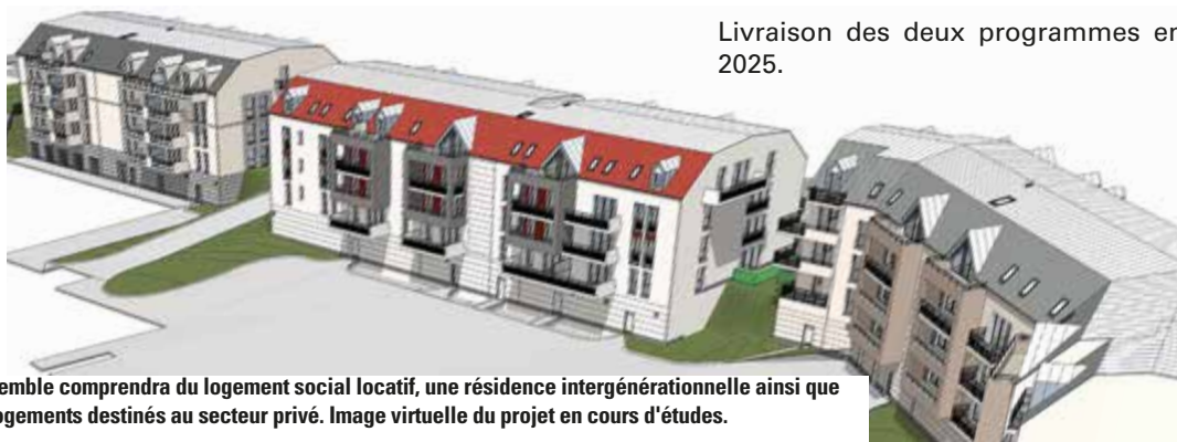
L'ensemble comprendra du logement social locatif, une résidence intergénérationnelle ainsi que des logements destinés au secteur privé. Image virtuelle du projet en cours d'études.