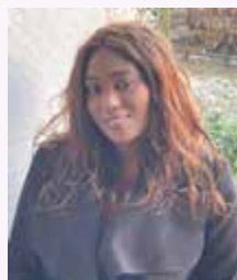
Houraye Pam Gadio Le Puits Drouet