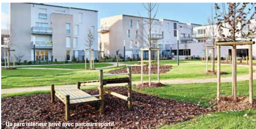
Un parc intérieur privé avec parcours sportif.