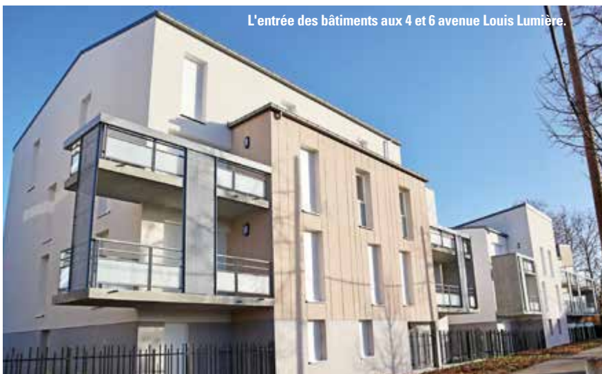
L'entrée des bâtiments aux 4 et 6 avenue Louis Lumière.

Chaque logement dispose par ailleurs de deux emplacements de stationnement numérotés et privatisés avec arceau.