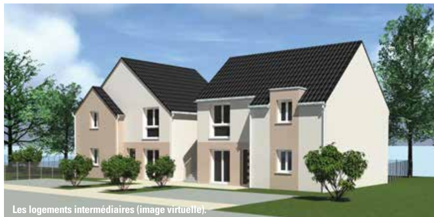
Les logements intermédiaires (image virtuelle).

location. (Les logements intermédiaires sont des appartements à mi-chemin entre le logement collectif et le logement individuel, disposant, chacun, d'une entrée indépendante). Les logements intermédiaires seront dotés de panneaux photovoltaïques.