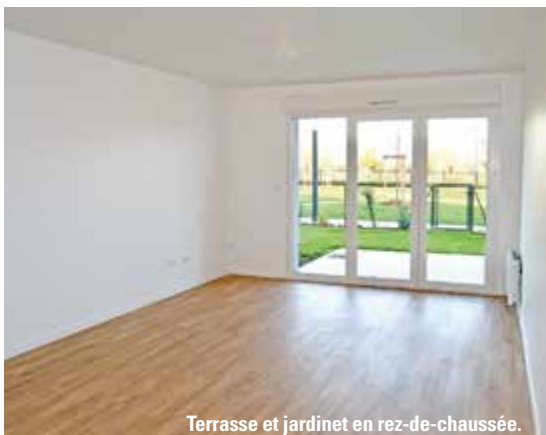
Terrasse et jardinet en rez-de-chaussée.