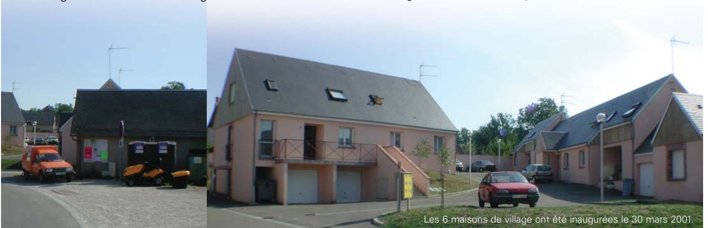
Les 6 maisons de village ont été inaugurées le 30 mars 2001.

"Cela fait peur aux élus de parler du logement social, ils craignent de voir arriver des cas difficiles. Nous avons veillé, surtout, à bien intégrer ces logements en les réalisant au cœur du village. Leur architecture a également